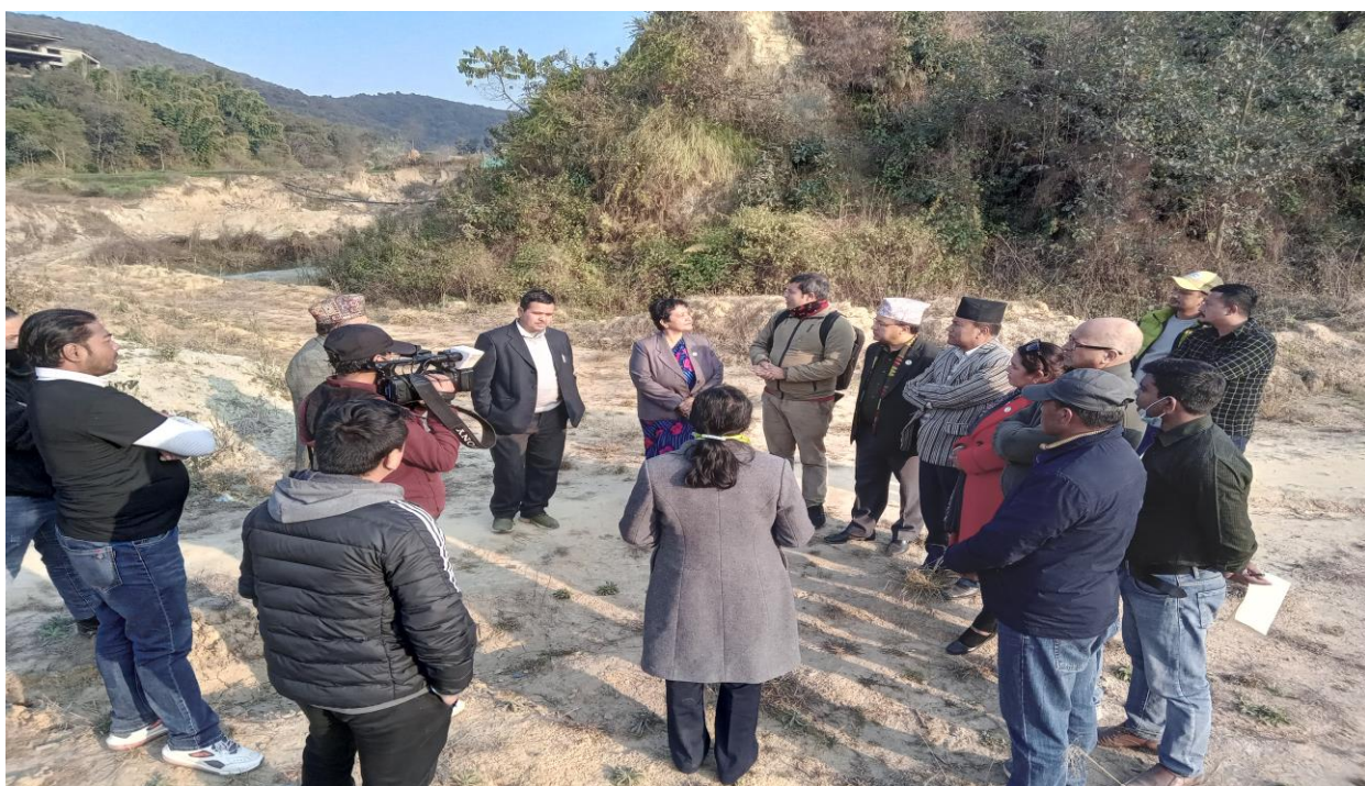
भक्तपुरको यातायात कार्यालयको लागि निर्धारित जग्गा बारे जानकारी लिँदै