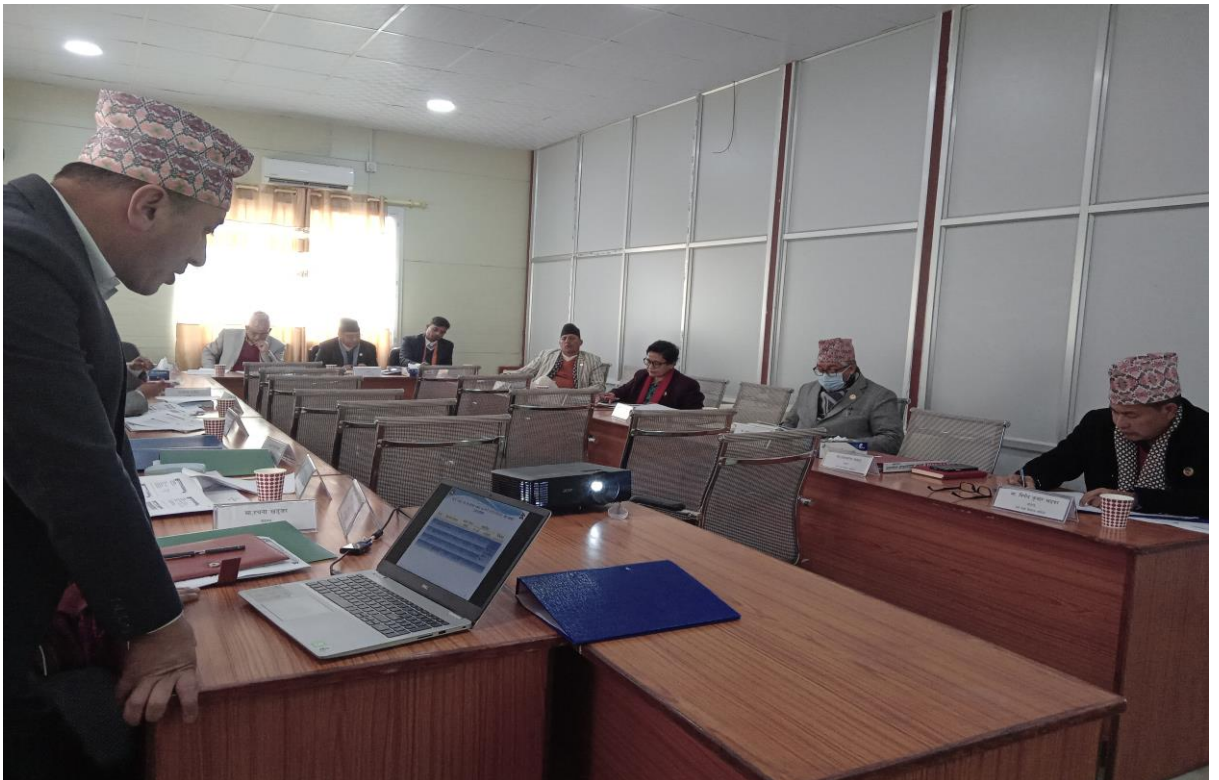
समितिको बैठकमा मन्त्रालयको कार्य प्रगति सम्बन्धी छलफल