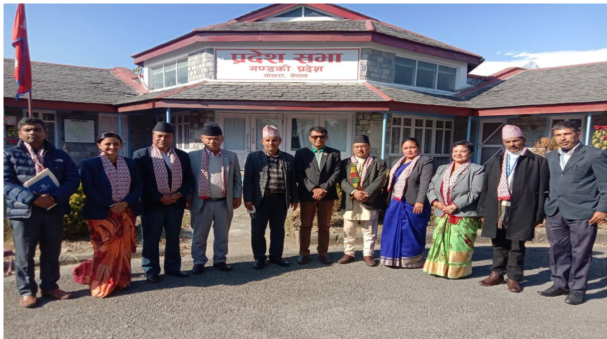
सभापति स्तरीय अनुभव आदान प्रदान कार्यक्रम, गण्डकी प्रदेश