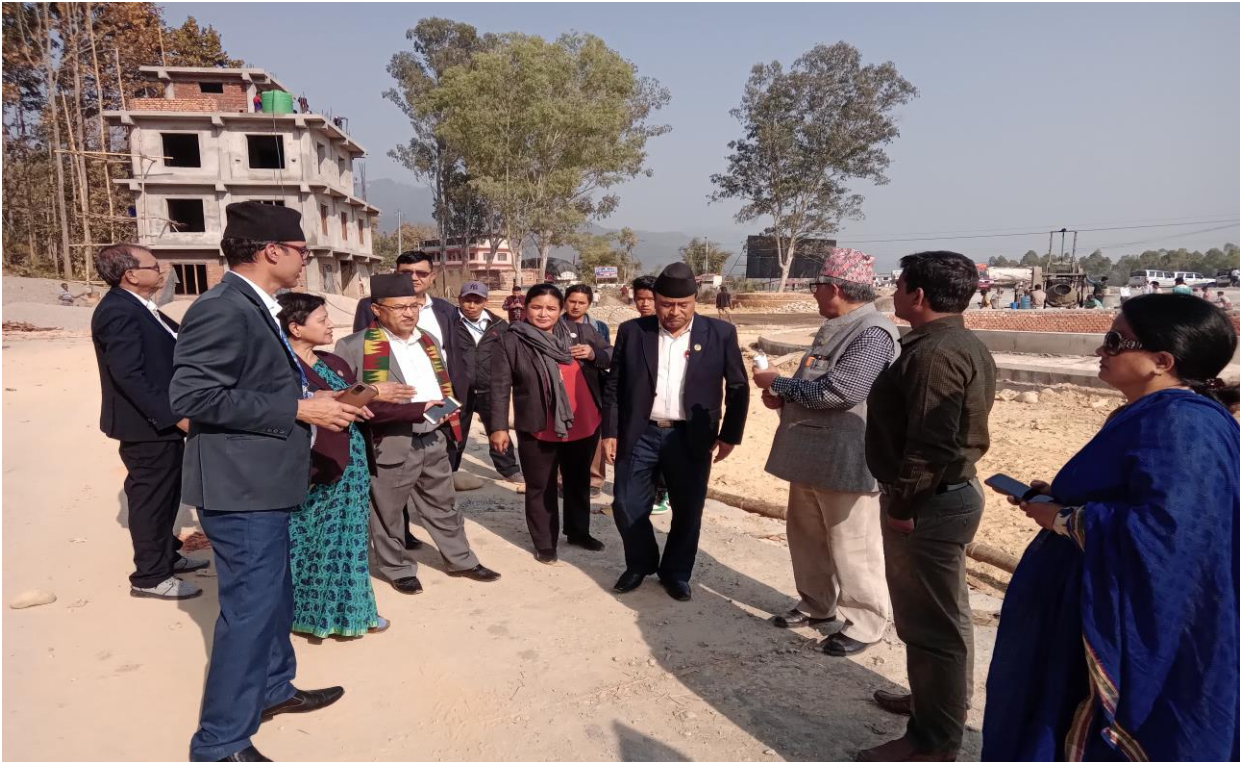
भिममान बसपार्क निर्माणको अनुगमन