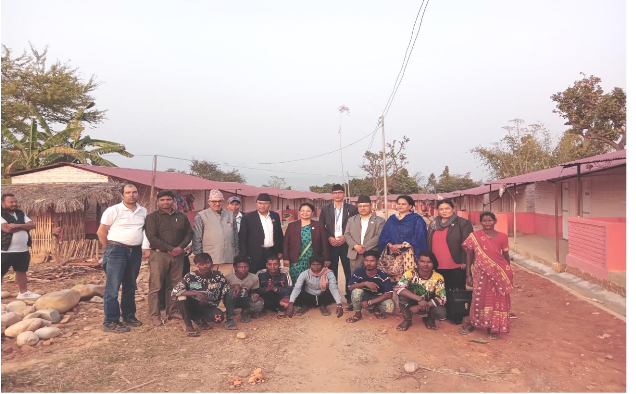
जनता आवस कार्यक्रम सिन्धुलीको अवलोकन