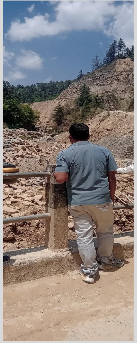
फाखेल-मातातिर्थ सडक(मकवानपुर खण्ड) सिमखोला पुलको अनुगमन गर्दै समितिका सदस्यहरू