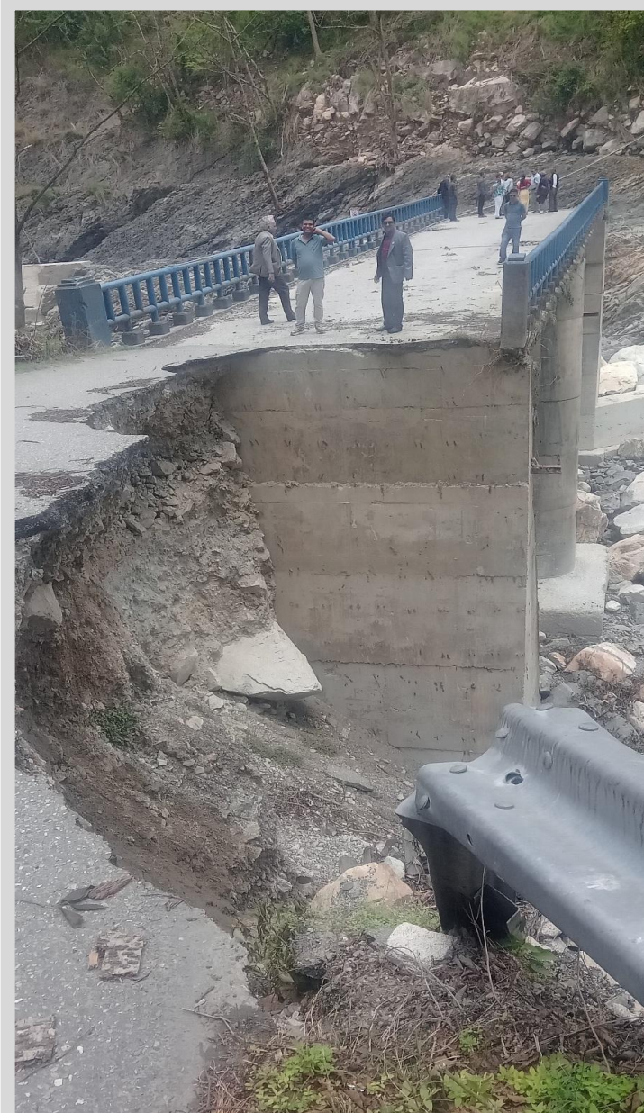
फाखेल-मातातिर्थ सडक(मकवानपुर खण्ड) सिमखोला पुलको अनुगमन गर्दै समितिका सदस्यहरू