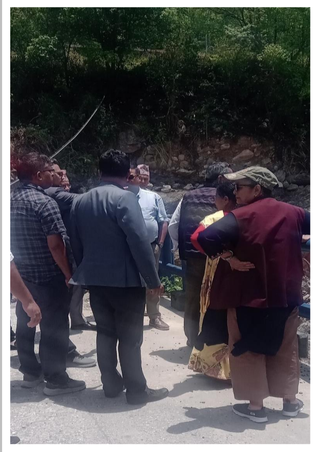
हेटौंडा-फाखेल-फर्पिङ्ग सडकको अनुगमन गर्दै समितिका सदस्यहरू