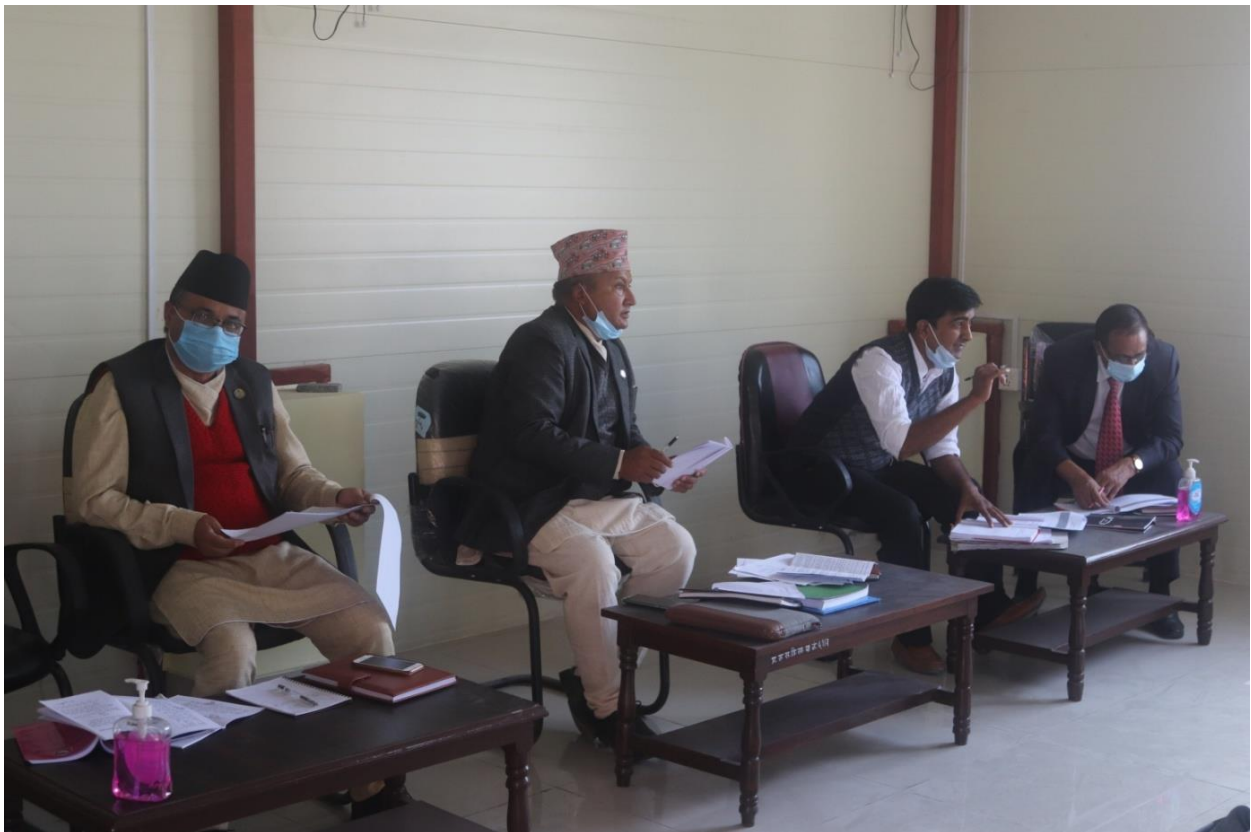
अर्थ तथा विकास समितिको छलफल कार्यक्रममा ।