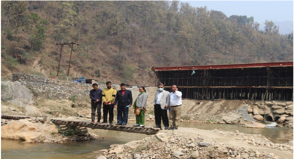
बालुवाटार फाँट मुहान सिंचाइ आयोजना, धादिङमा लिईएको सामूहिक तस्विर ।