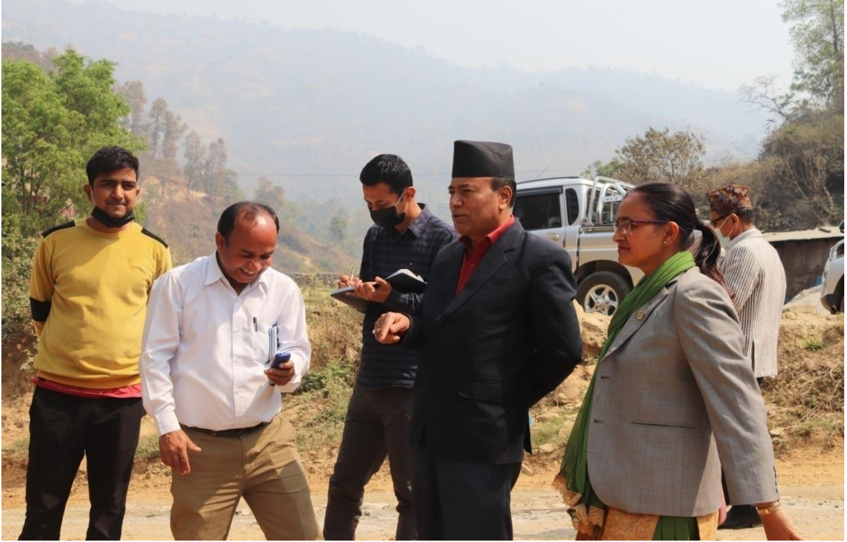
बालुवाटार फाँट मुहान सिंचाइ आयोजना, धादिङ अनुगमन गर्ने क्रममा ।