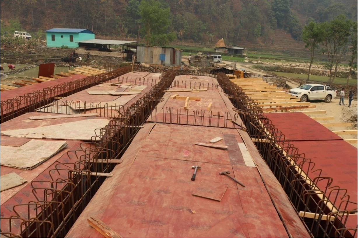
पूर्वाधार विकास कार्यालय नुवाकोटबाट निर्माणाधिन पुल ।