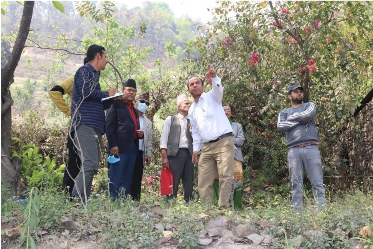
बालुवाटार फाँट मुहान सिंचाइ आयोजना, धादिङ अनुगमन गरी छलफल गर्ने क्रममा ।