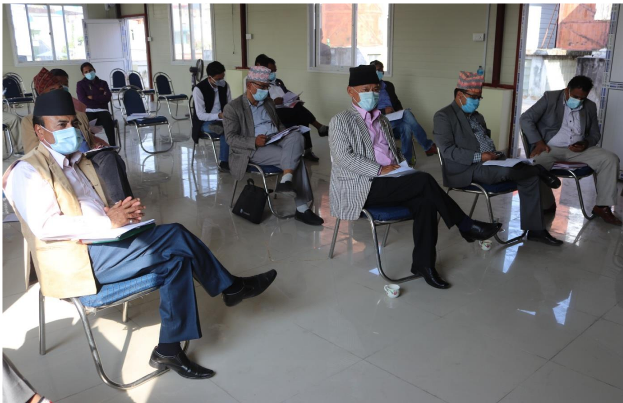
अर्थ तथा विकास समितिको छलफल कार्यक्रममा ।