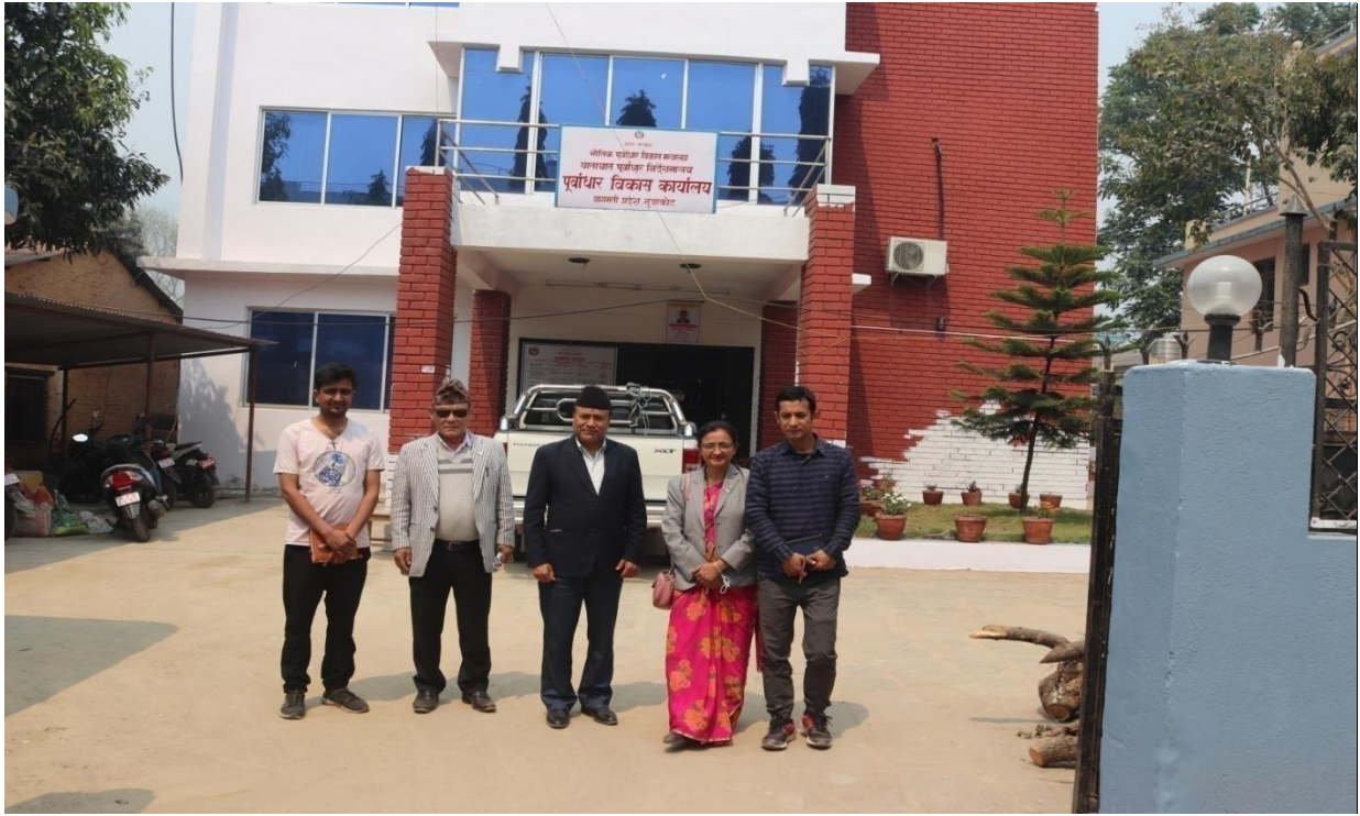
पूर्वाधार विकास कार्यालय नुवाकोटको अनुगमनको सिलसिलामा ।