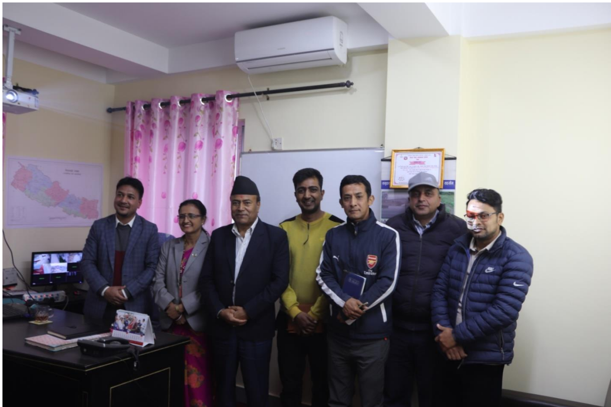
जलस्रोत तथा सिंचाइ विकास सब-डिभिजन, रसुवामा भएको छलफल पछि कार्यालय प्रमुखसँग ।