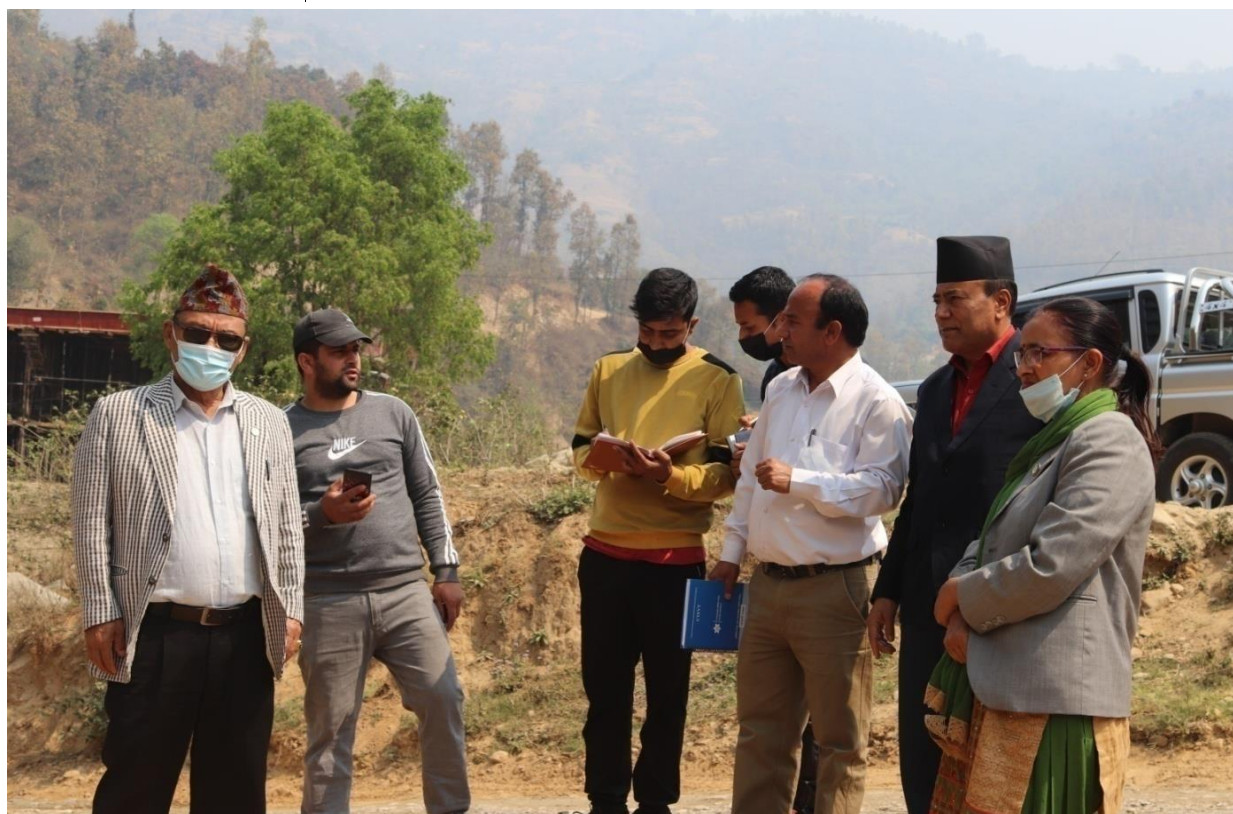
बालुवाटार फाँट मुहान सिंचाइ आयोजना, धादिङ अनुगमन गरी छलफल गर्ने क्रममा ।