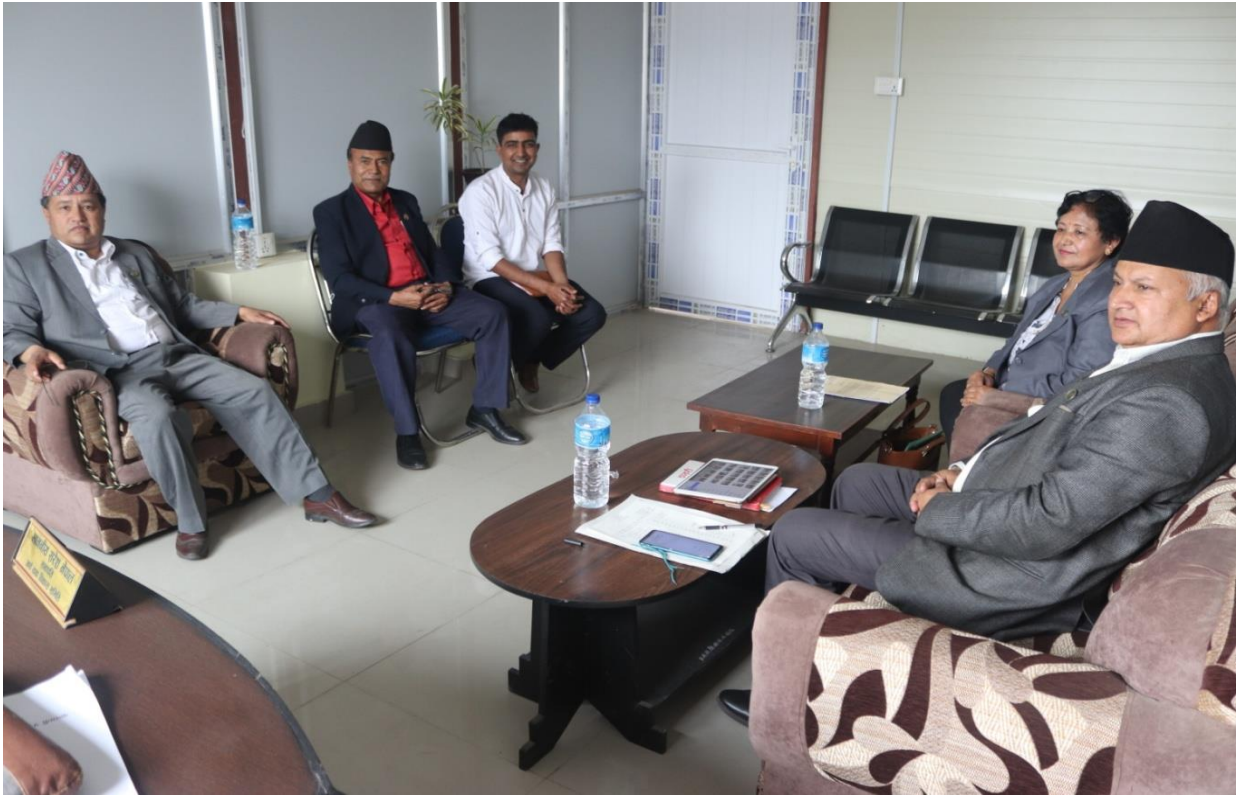
अर्थ तथा विकास समितिको छलफल कार्यक्रममा ।