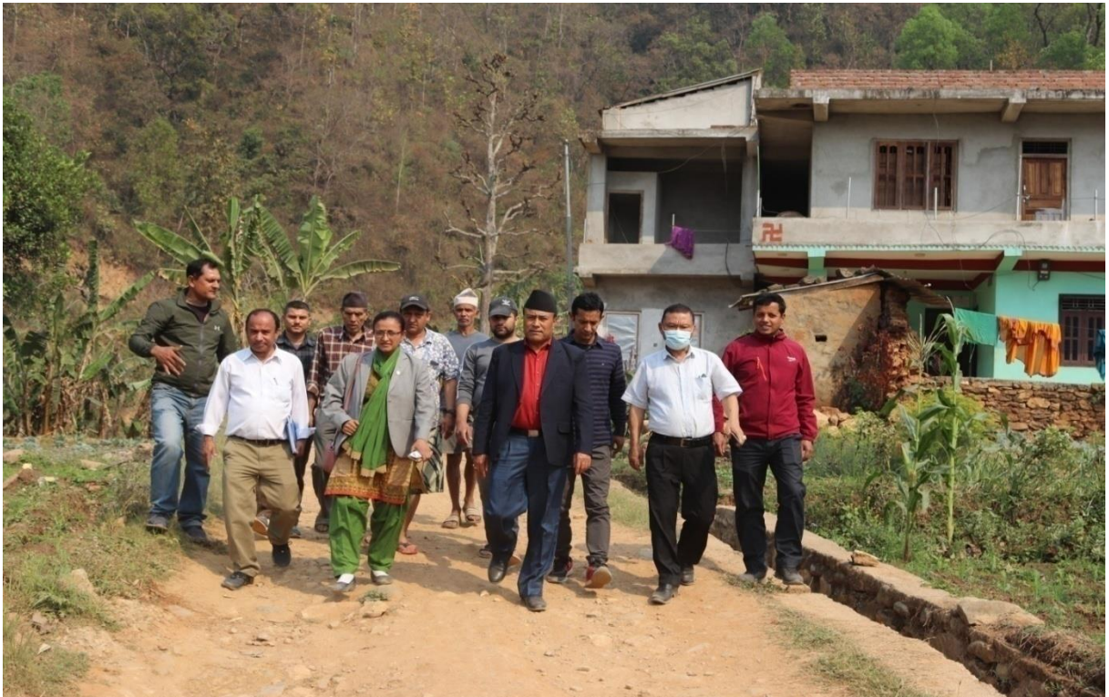
बालुवाटार फाँट मुहान सिंचाइ आयोजना, धादिङमा उपभोक्ता समितिको अध्यक्ष तथा प्राविधिक कर्मचारीसँग भएको छलफल ।