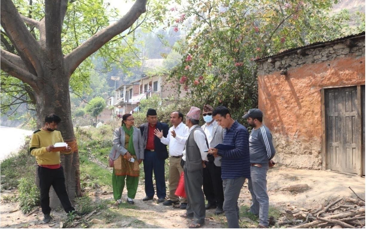
बालुवाटार फाँट मुहान सिंचाइ आयोजना, धादिङमा उपभोक्ता समितिको अध्यक्ष तथा प्राविधिक कर्मचारीसँग भएको छलफल ।