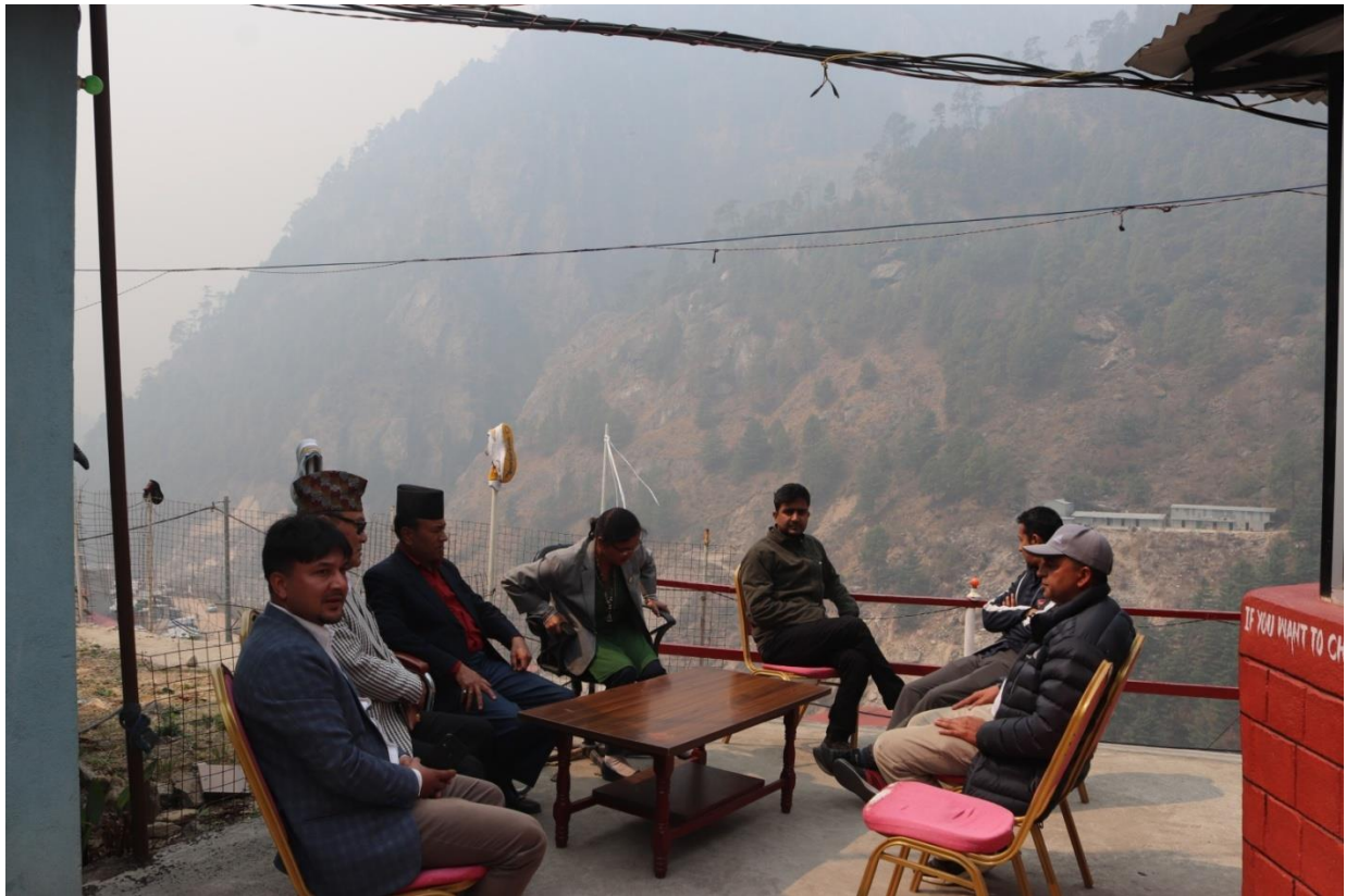
जलस्रोत तथा सिंचाइ विकास सव-डिभिजन, रसुवामा भएको छलफल पछि कार्यालय प्रमुखसँग ।