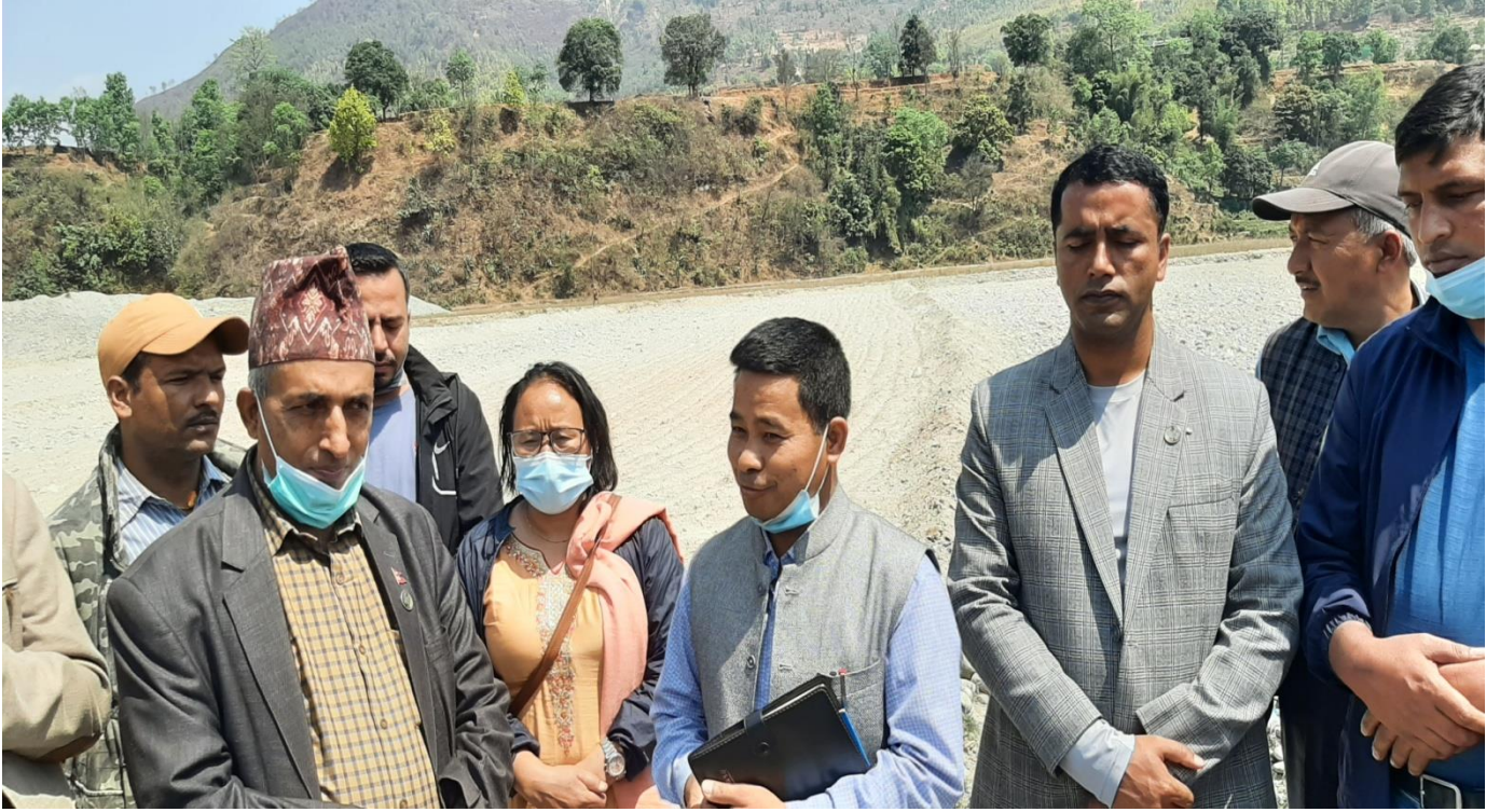
इन्द्रावती गा.पा.११ मा सामूहिक खेतीको अध्ययन अवलोकन भ्रमणमा वडा अध्यक्ष सामूहिक खेतीको बारेमा जानकारी गराउँदै ।