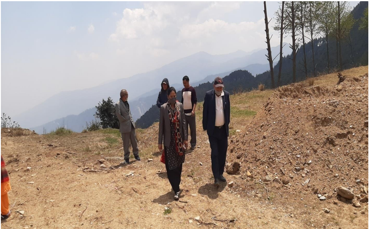
दोलखा जिल्लाको भिमेश्वर न.पा.८ बोचमा कालिञ्चोक गाई फार्म माननीय सदस्यहरु अवलोकन गर्दै