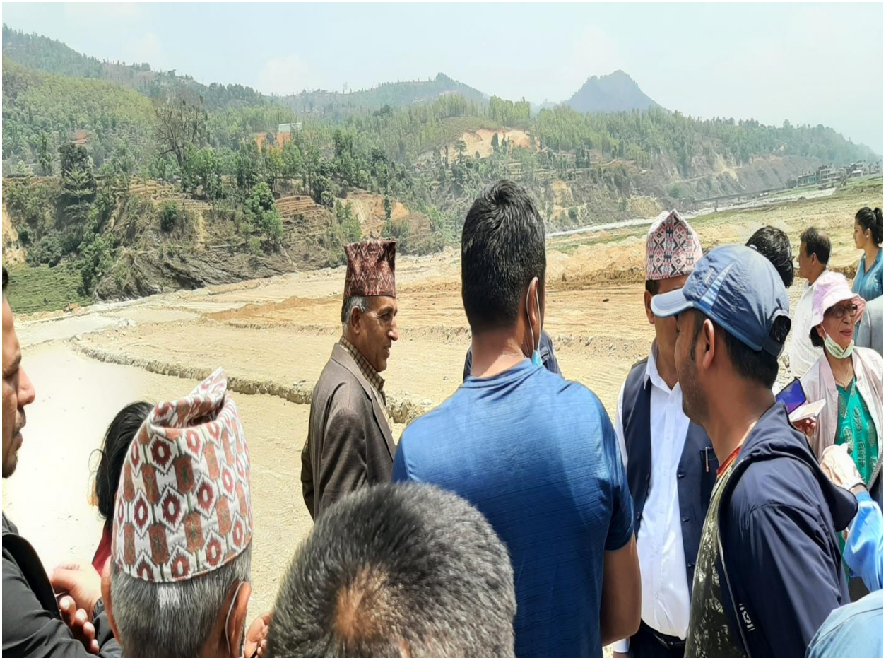
माननीय सदस्यहरु सामूहिक खेतीको अध्ययन अवलोकन गर्दै