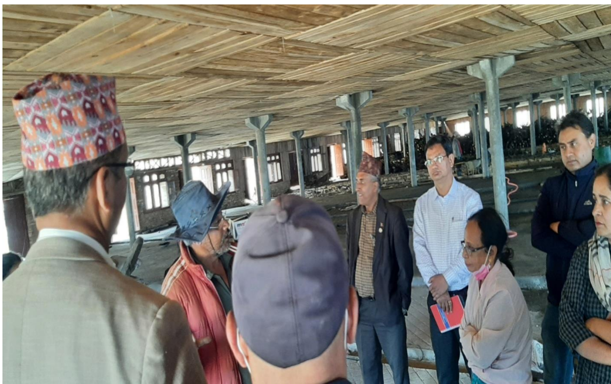
दोलखा जिल्लाको भिमेश्वर न.पा.८ बोचमा कालिञ्चोक गाई फार्ममा माननीय सदस्यहरु अध्ययन अवलोकन गर्दै