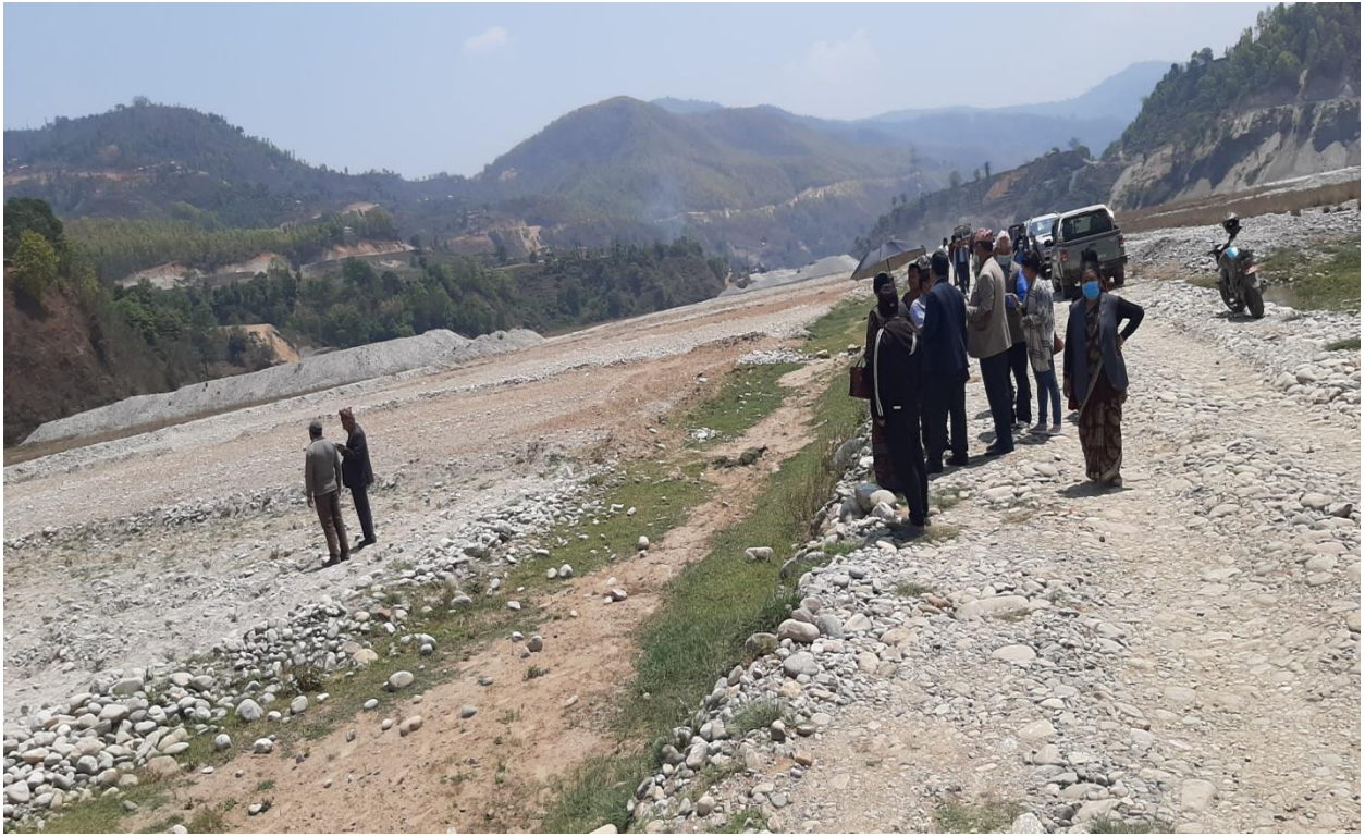
माननीय सदस्यहरु सामूहिक खेतीको अध्ययन अवलोकन गर्दै