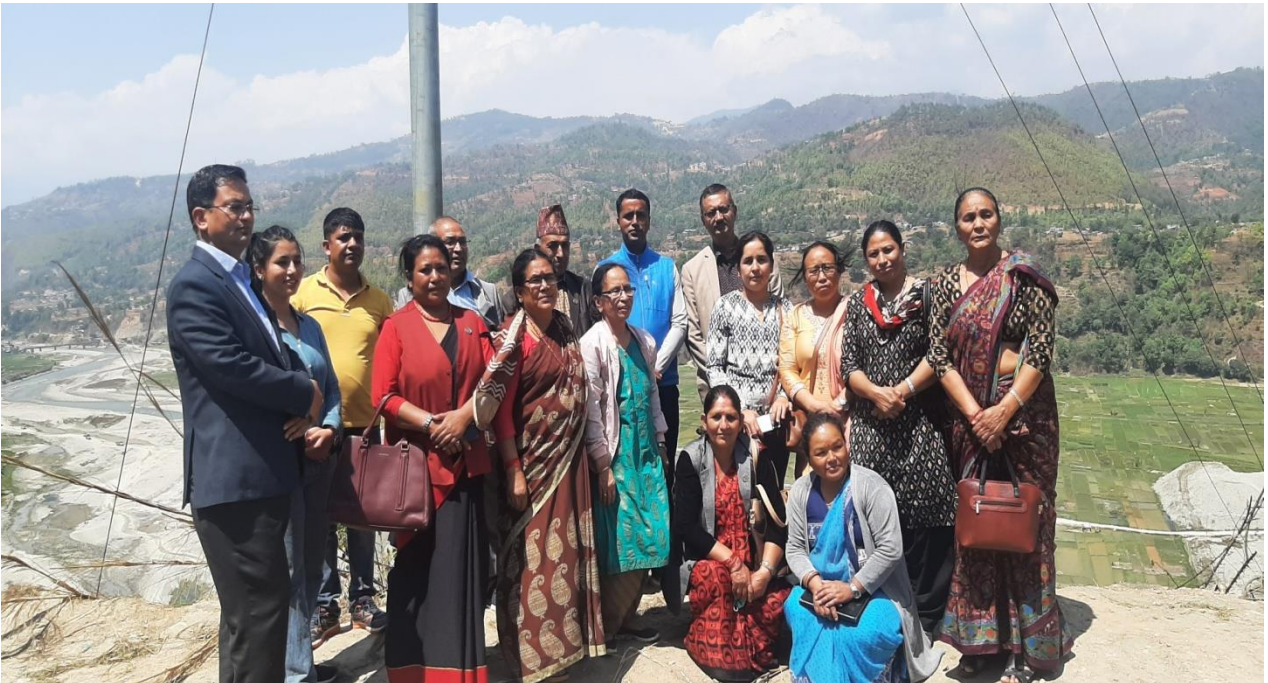
सामूहिक खेतीको अध्ययन अवलोकन पश्चात माननीय सदस्यहरु फोटो खिंचाउँदै