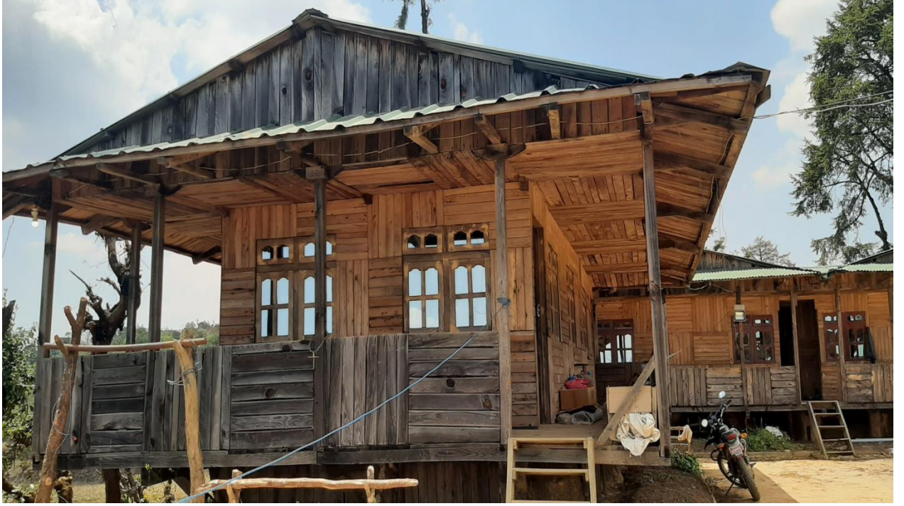
कालिञ्चोक गाई फार्ममा कर्मचारी बस्नको लागि बनाइएको काठको घर