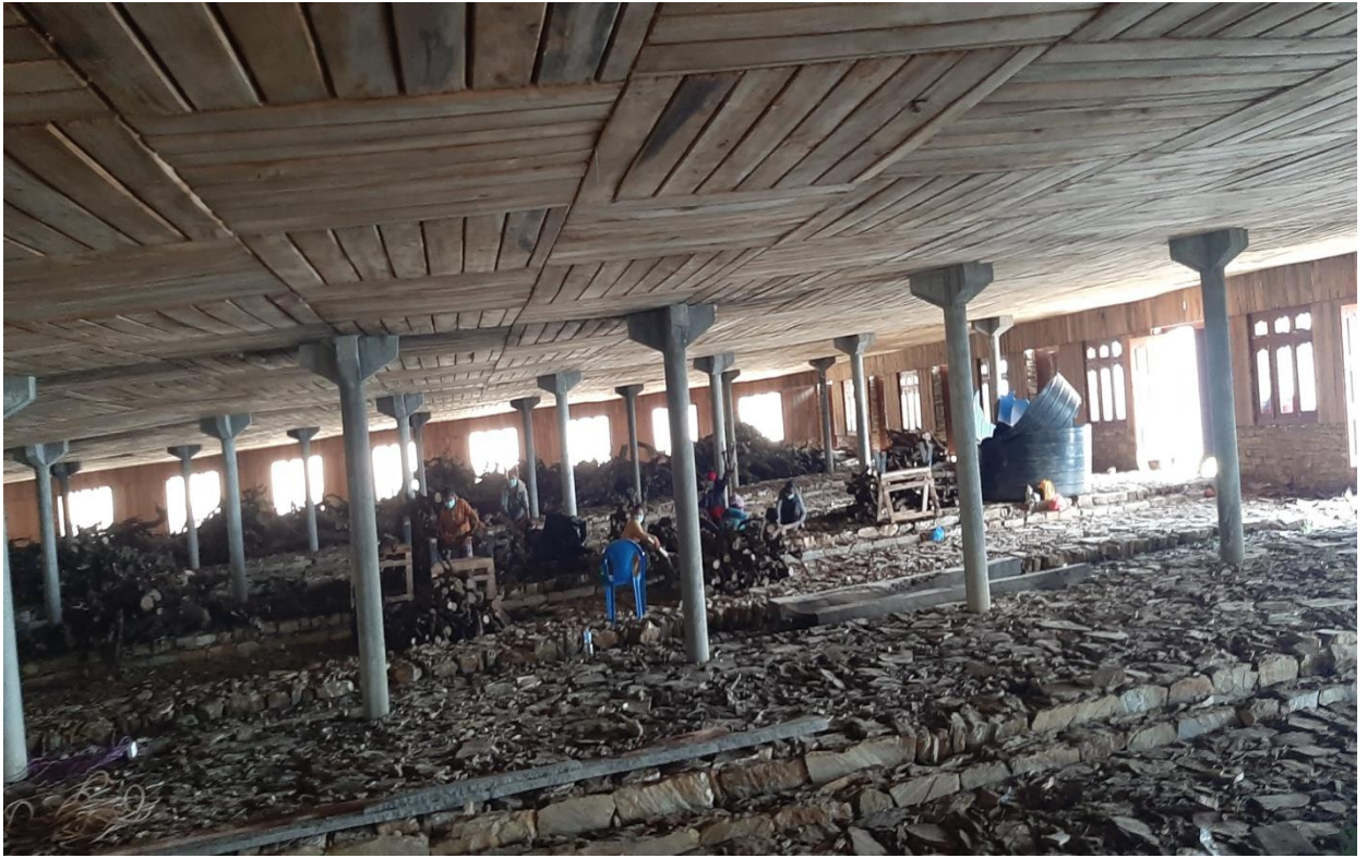
दोलखा जिल्लाको भिमेश्वर न.पा.८ बोचमा कालिञ्चोक गाई फार्म तयार हुंदै