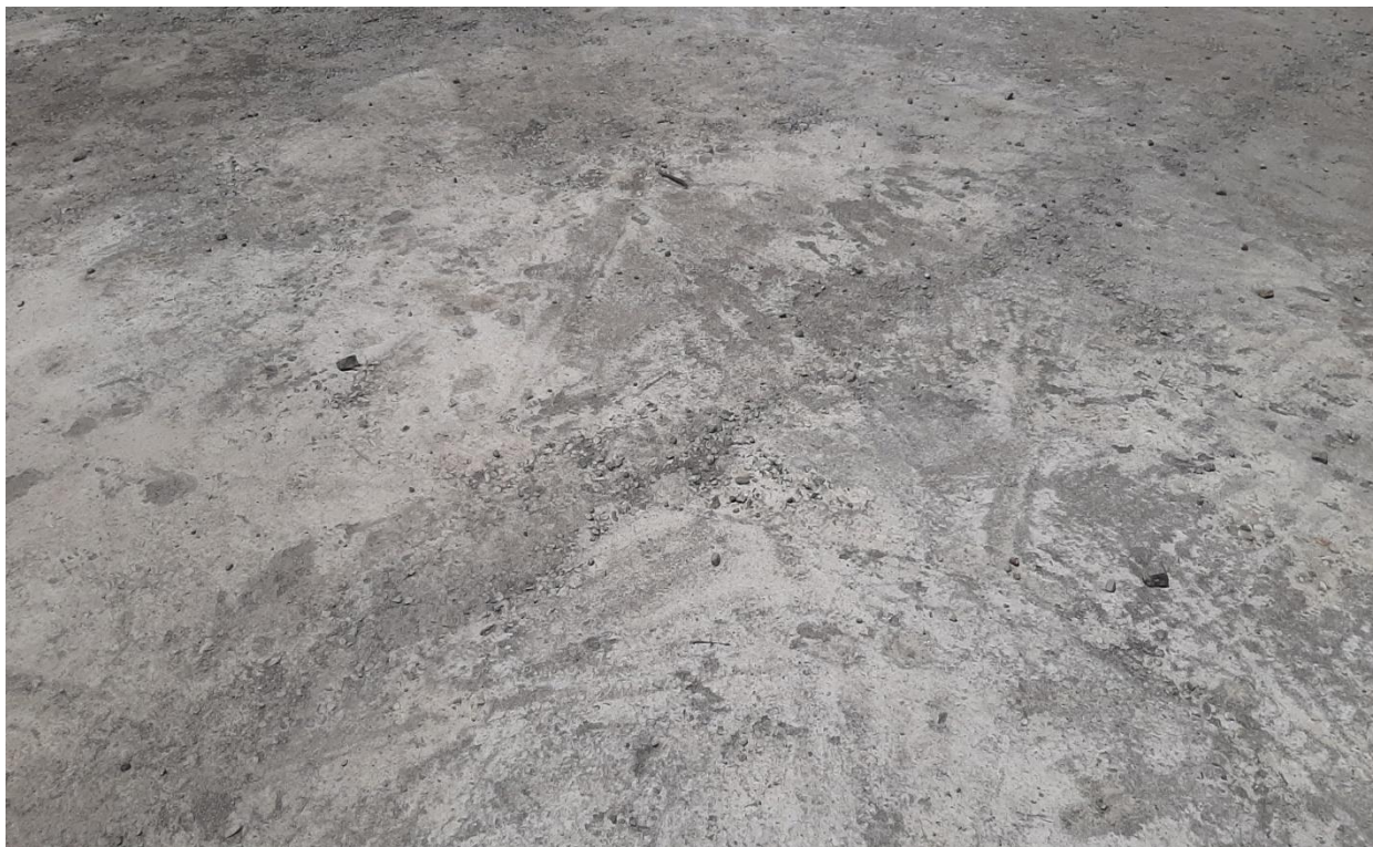
दोलखा जिल्लाको भिमेश्वर न.पा.८ बोचमा शित भण्डारणको लागि भुईँ ढलान गरिएको