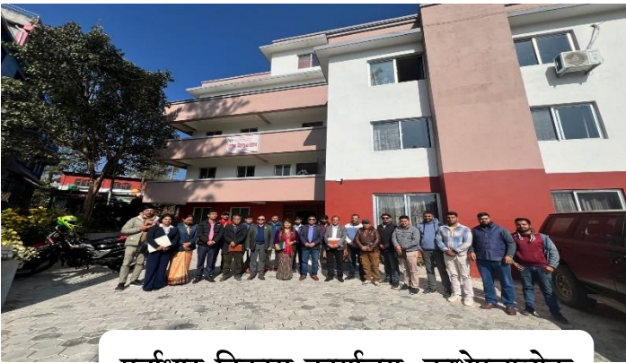
पूर्वाधार विकास कार्यालय, काभ्रेपलाञ्चोक