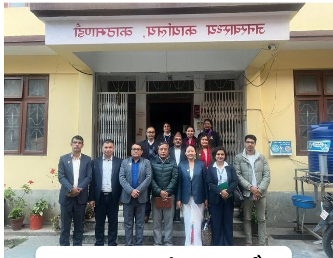
जनस्वास्थ्य कार्यालय, काठमाडौं