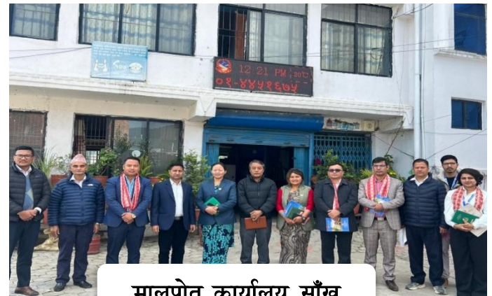
मालपोत कार्यालय, साँखु