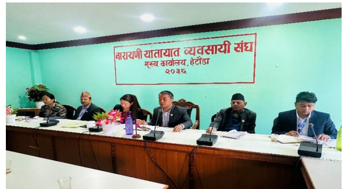
सरोकारवाला पक्षसँग अन्तर्क्रिया कार्यक्रम, हेटौडा