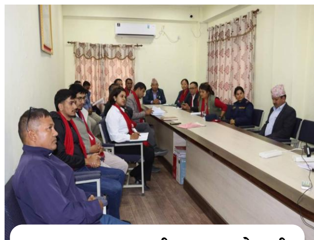
दहत्तर बहत्तर सम्बन्धी छलफल, मेलम्ची नगरपालिका, सिन्धुपाल्चोक