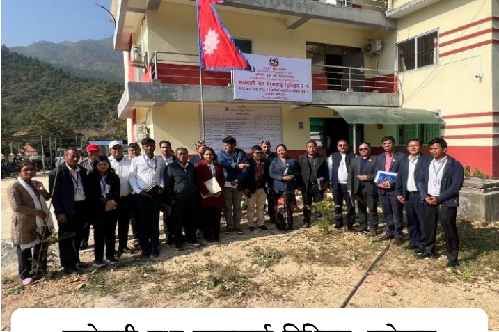
खानेपानी तथा सरसफाई डिभिजन, रामेछाप