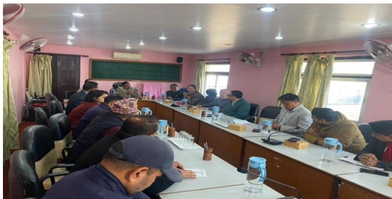
सराकारपाली पदासंग जनताक्रिया कार्यक्रम, हेटौंडा