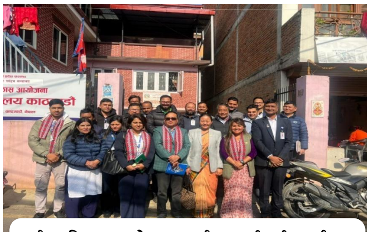
पर्यटन विकास आयोजना कार्यान्वयन ईकाई कार्यालय, काठमाडौं