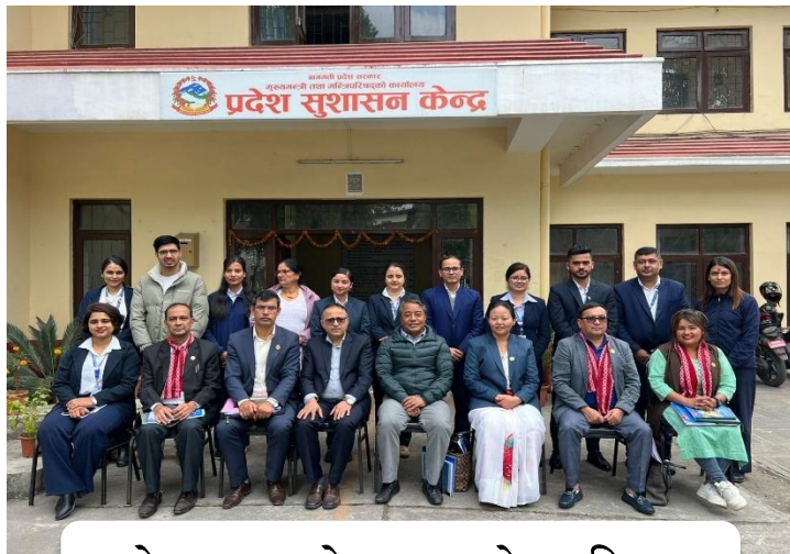
प्रदेश सुशासन केन्द्र, जावलाखेल, ललितपुर