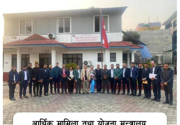
आर्थिक मामिला तथा योजना मन्त्रालय, बागमती प्रदेश