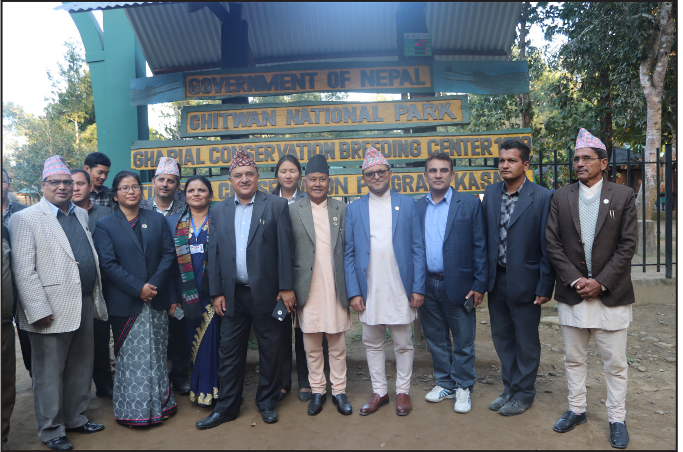
सभामुख, उपसभामुखहरूको सामूहिक तस्वीर