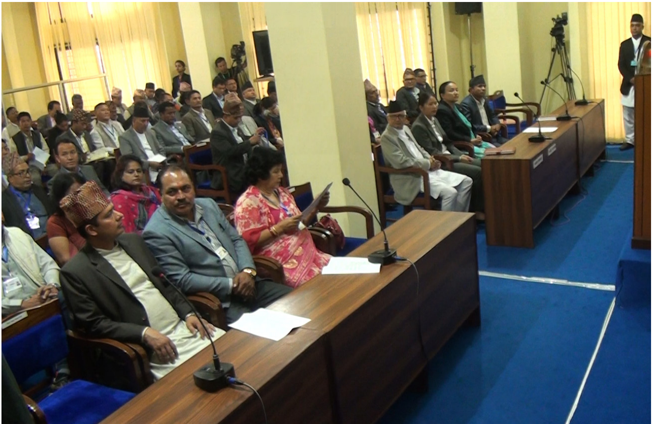
प्रदेश सभा बैठकको झलक