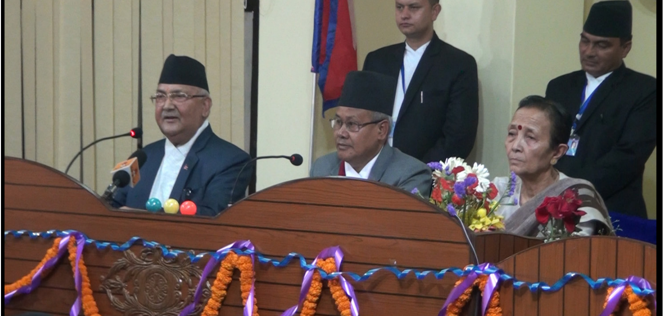
अन्तर प्रदेश सभामुख, उपसभामुख अनुभव आदान प्रदान कार्यक्रमको भलक