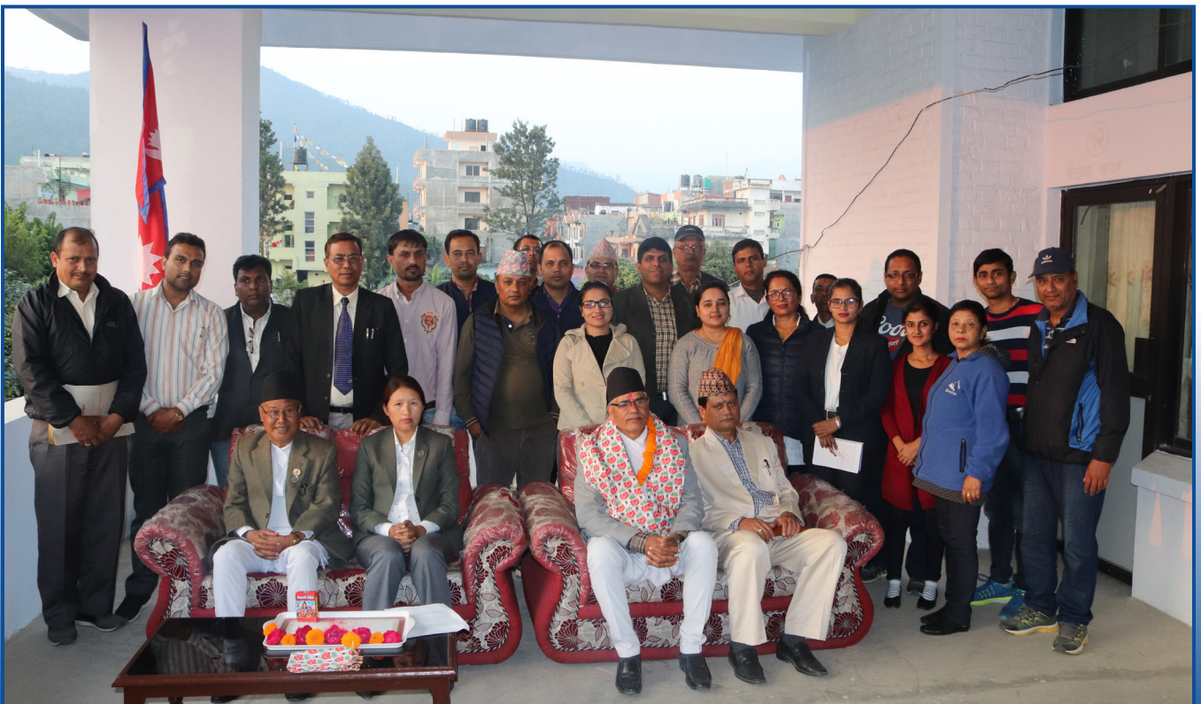
प्रदेश सभा सचिवालय परिवार