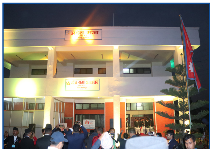
Orange the world कार्यक्रमको झलक