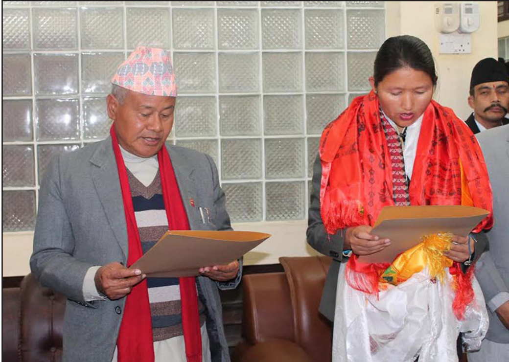
माननीय उपसभामुखज्यूको शपथ ग्रहण