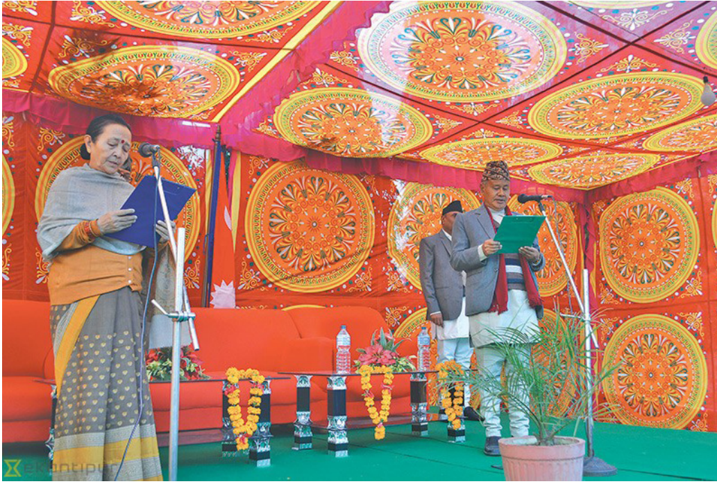
माननीय सभामुखज्यूको शपथ ग्रहण