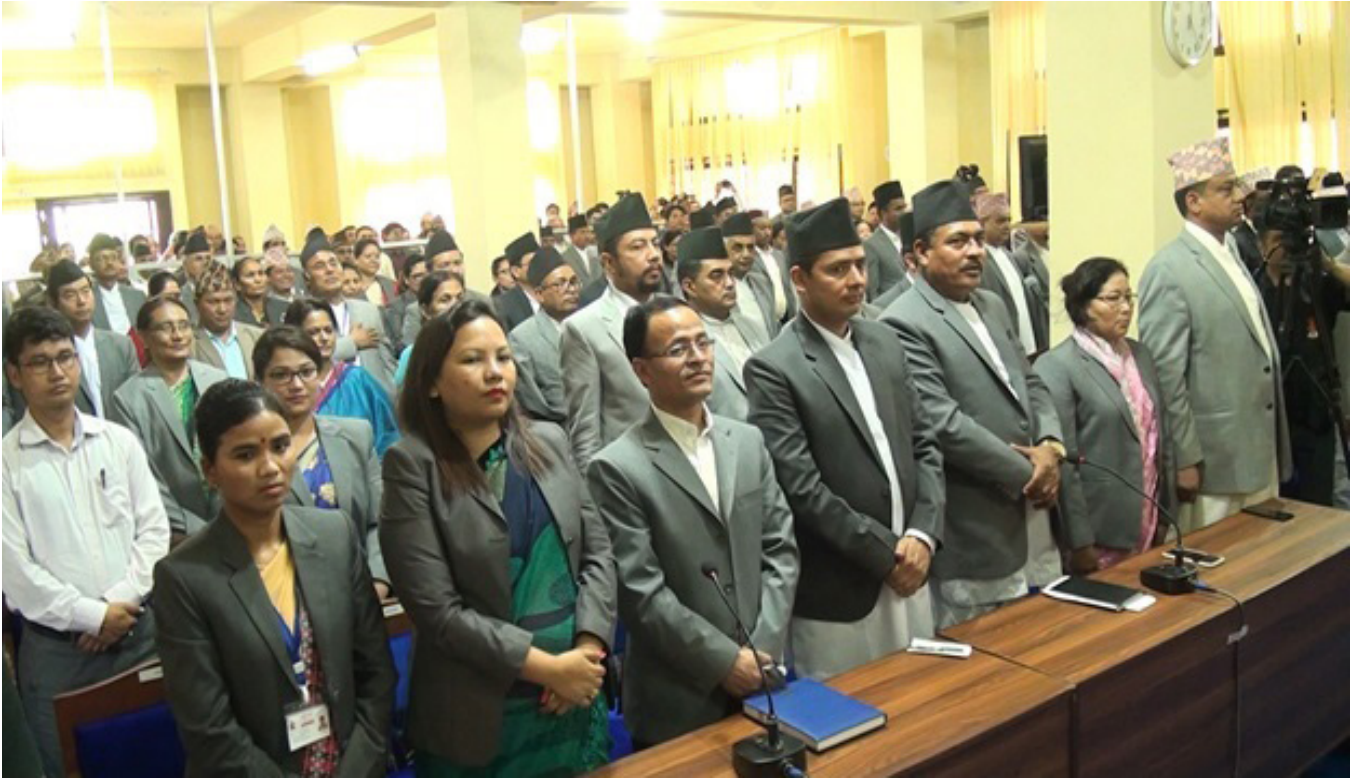
प्रदेश सभा बैठकको झलक