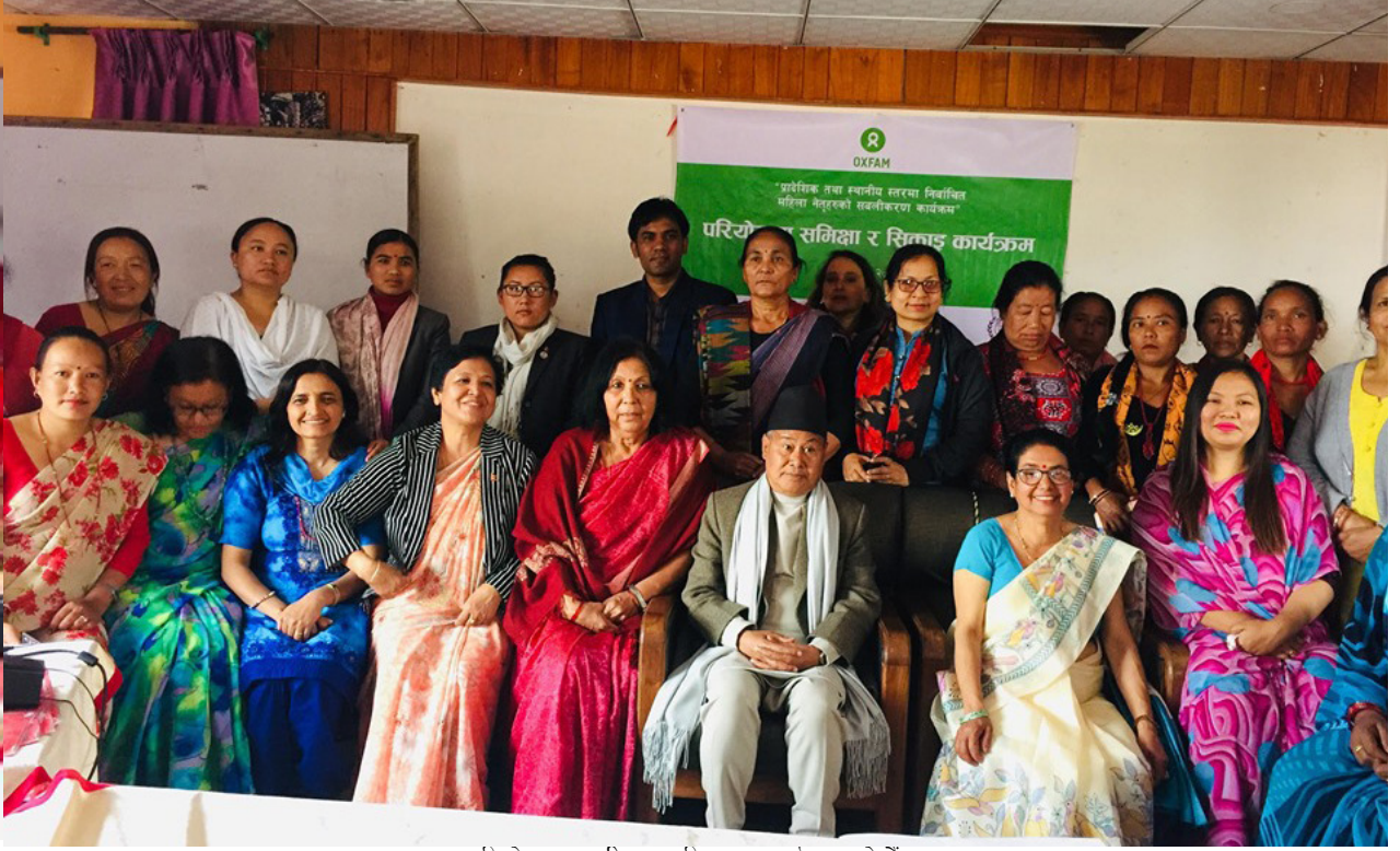
परियोजना समीक्षा र सिकाइ कार्यक्रम, हेटौंडा