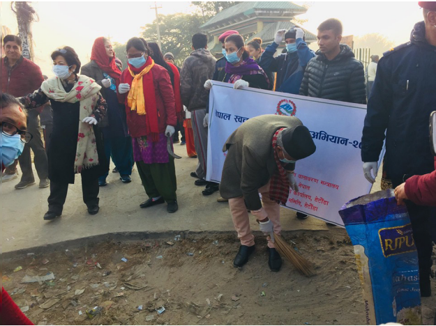
सडक तथा टोल सरसफाई कार्यक्रम, हेटौंडा बजार