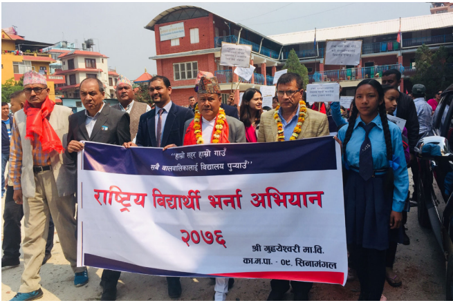
विद्यार्थी भर्ना अभियान काठमाण्डौ