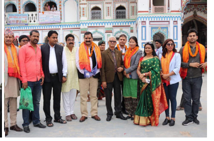
हावाहुरी पीडितको लागि सहयोग रकम हस्तान्तरण