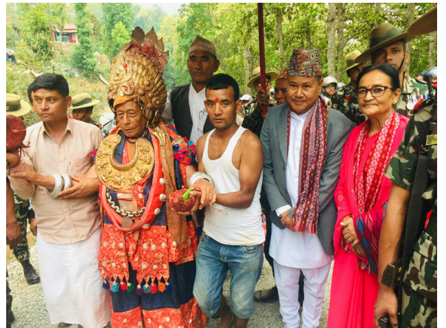
सिन्दुरे जात्रा नुवाकोट