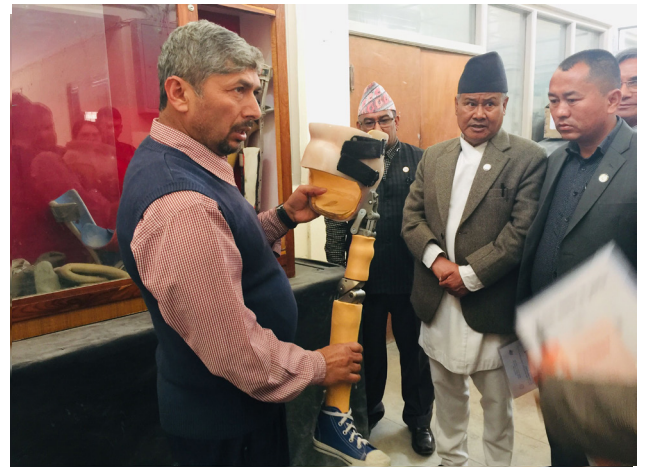
अपाङ्ग बाल अस्पताल तथा पुनर्स्थापना केन्द्र अवलोकन, काभ्रे