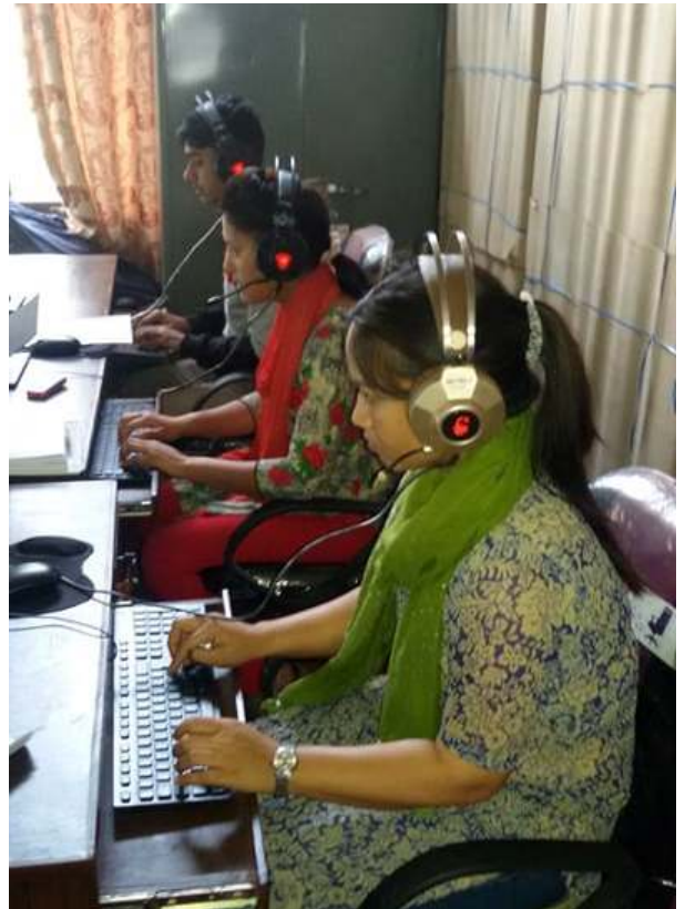
सम्पूर्ण विवरणको कार्यारम्भ