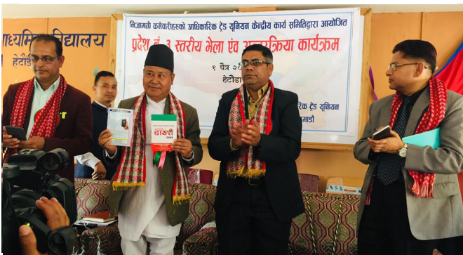
प्रदेश नं. ३ को पर्यटन ब्रान्ड सार्वजनिकीकरण तथा जुगल हिमाल