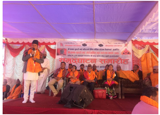
लेले धार्मिक महामहोत्सव, ललितपुर