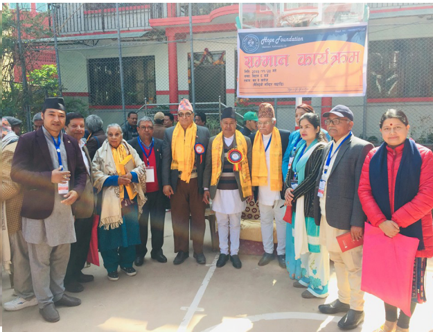
समाज परिवर्तनको लागि सामाजिक संस्थाहरूको भूमिका, काठमाण्डौ